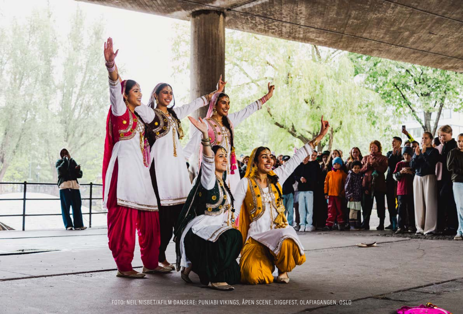
DANSERE: PUNJABI VIKINGS, ÅPEN SCENE, DIGGFEST, OLAFIAGANGEN, OSLO