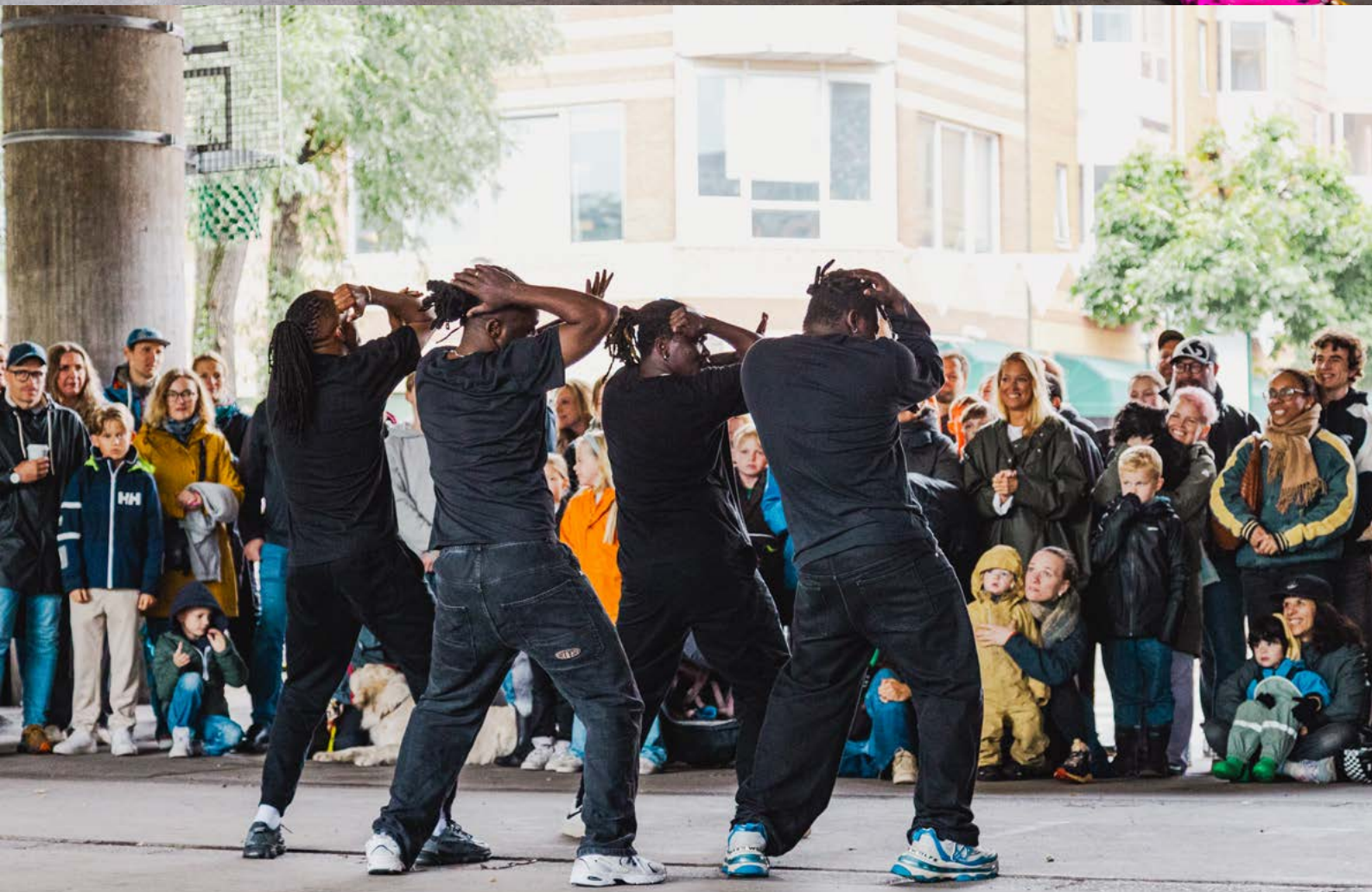
DANSERE: MATATA, ÅPEN SCENE, DIGGFEST, OLAFIAGANGEN, OSLO